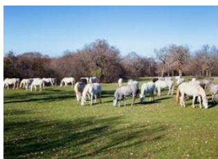
Štanjel 📍 🚲 48km Divaca 📍