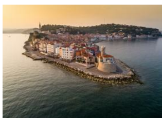
Muggia 📍 🚲 37km Piran 📍