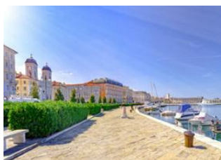
Divaca 📍 🚲 38km Trieste 📍 🚲 12km Muggia 📍